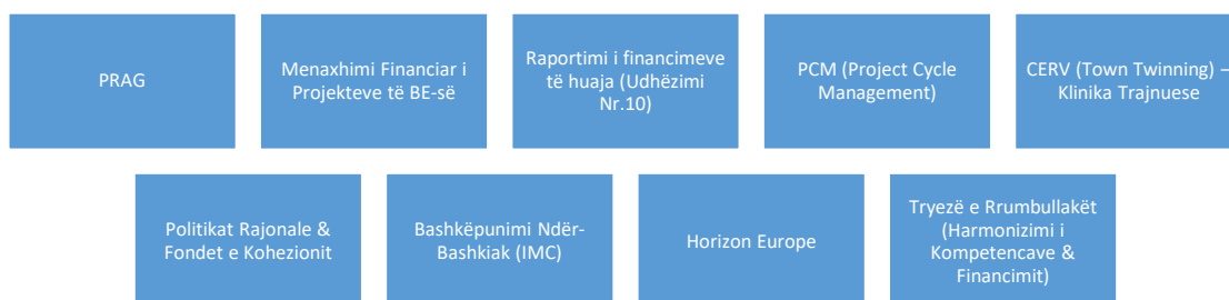
Tabela 3: Tabela fushave të trajnimit të ofruara: Janar – Dhjetor 2024

Me qëllim rritjen e kapaciteteve të njëjësive të Integritimit Evropian në çdo bashki, gjatë vitit 2024, AMVV ka organizuar 9 aktivitete, 7 trajnime dhe 2 seminare, me 443 pjesëmarrës, nga të cilët 385 persona kanë ndjekur trajnimet e organizuara në bashkëpunim me ASPA. Këto aktivitete u mbështetën me ekspertizë nga projekte si BpE, EU4GoodGovernance dhe SIGMA dhe AKKSHI. Fokus kryesor ishin menaxhimi financiar, shkrimi i projekteve, procedurat PRAG dhe politikave të BE-së. Synimi ishte përmirësimi i shërbimeve publike dhe zbatimi i fondeve sipas standardeve evropiane për të mbështetur integrimin e Shqipërisë në BE.